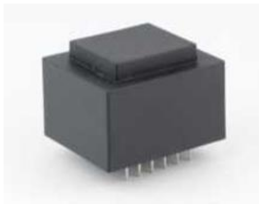
Фотография готового изделия