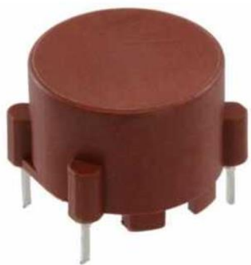
Фотография готового изделия