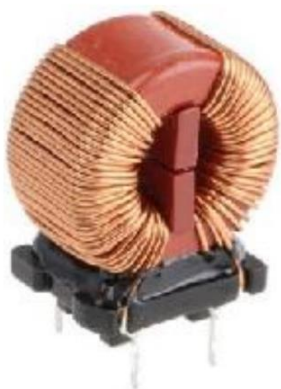
Фотография готового изделия