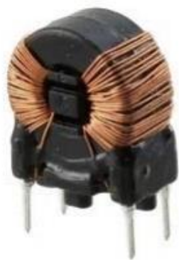
Фотография готового изделия