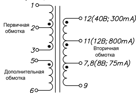
Схема электрическая принципиальная

Примечание: а) Все материалы соответствуют требованиям стандартов "UL", "CSA" и "IEC". б) Изделие покрыто электротехническим лаком.