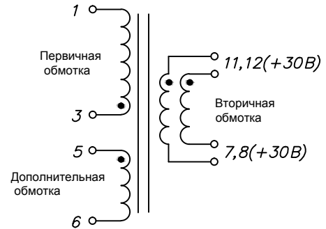
Схема электрическая принципиальная

Выходы №12, №11 и №8, №7 должны быть, соответственно, соединены друг с другом.