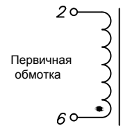
Схема электрическая принципиальная