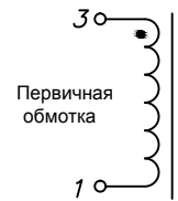
Схема электрическая принципиальная