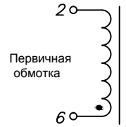
Схема электрическая принципиальная